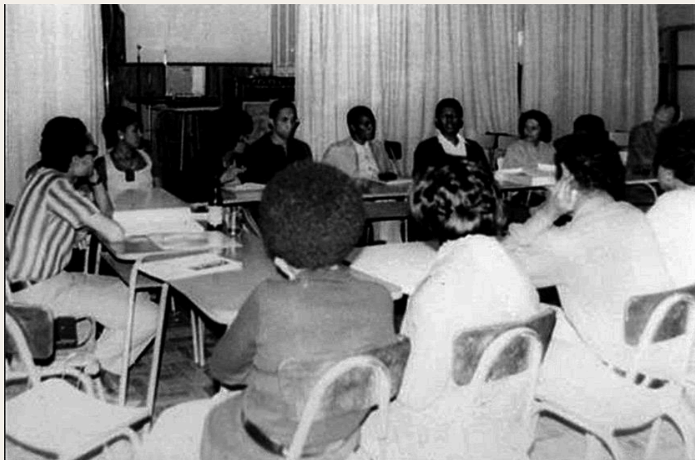
Primeiro ato evocativo ao 20 de Novembro, realizado em 1971 pelo Grupo Palmares, em Porto Alegre.

Zumbi dos Palmares foi um importante líder e símbolo de resistência, assassinado em 20 de novembro de 1695 durante uma emboscada da tropa portuguesa. Pouco se tem registrado sobre como foi a vida de Zumbi, que nasceu em 1655 e viveu em liberdade no Quilombo dos Palmares, atualmente interior de Alagoas, nordeste do Brasil. Ele ganhou notoriedade em 1675, quando lutou contra um dos ataques das tropas portuguesas ao seu quilombo. Foi casado com Dandara, com quem teve três filhos, e juntos lutaram principalmente pela liberdade do povo negro escravizado. [2, 3]