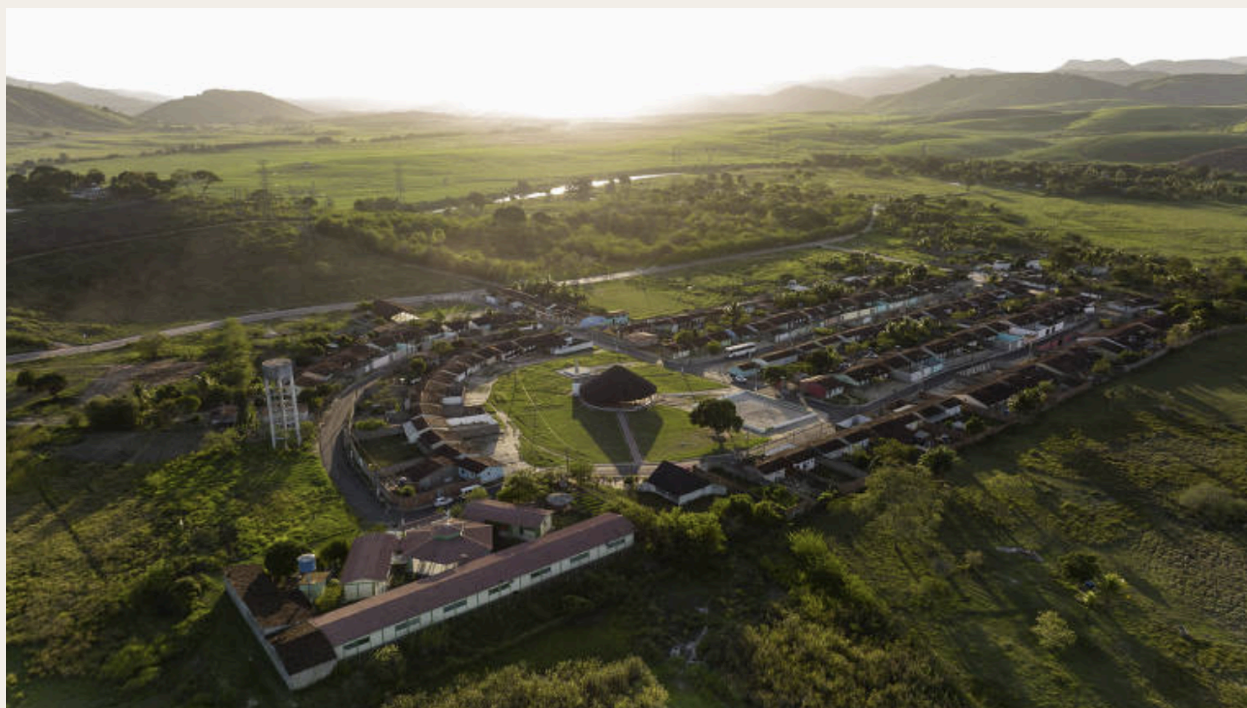
Comunidade quilombola do Muquém, em Alagoas.

Atualmente, a área do Quilombo dos Palmares abriga o Parque Memorial Quilombo dos Palmares, que preserva as histórias e construções da época, e está localizado a 70km da capital do estado de Alagoas, Maceió. Ao seu redor, alguns quilombos mantêm a história viva e abriga centenas de quilombolas, como a Comunidade do Muquém, a única remanescente do Quilombo dos Palmares, considerada patrimônio da memória afro-indígena brasileira.