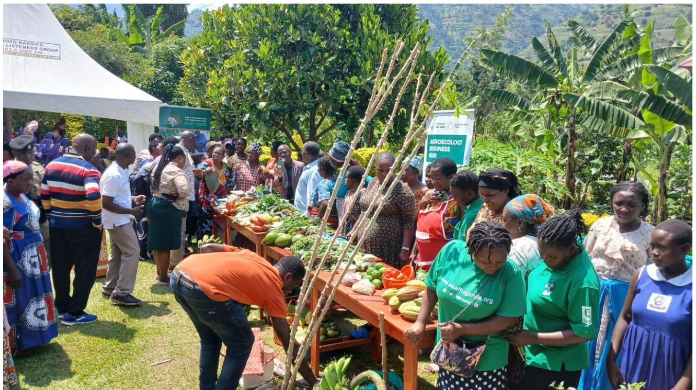
Pequeños agricultores y agricultoras exhibiendo sus productos durante el evento en la Escuela Comunitaria de Agroecología (CAS) de Kisanga en Kasese.

La declaración también enfatizó la contribución vital de las mujeres agricultoras en el fomento de sistemas alimentarios sostenibles. La declaración resaltó la necesidad de una adopción más amplia de la agroecología y pidió al gobierno que asegure los derechos de las mujeres a la tierra, proteja las tierras de cultivo de inundaciones y vida silvestre, mejore el valor agregado, regule los insumos agrícolas nocivos y ofrezca compensación a las comunidades afectadas por las inundaciones del río Nyamwamba: un grito de guerra por una agricultura inclusiva y sostenible.