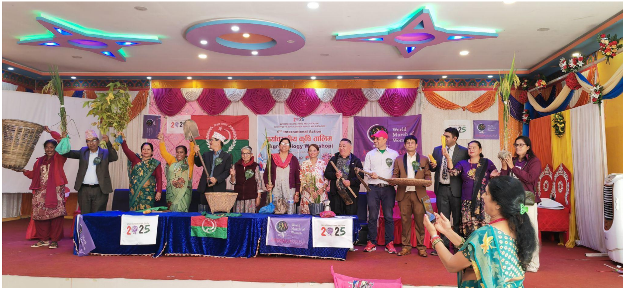
Escenas del Taller de Agroecología.

En un esfuerzo colaborativo, la Marcha Mundial de las Mujeres - Nepal, Sristi Sewa Semaj y la Federación de Campesinos de Todo Nepal organizaron un programa de 3 días que culminó en una manifestación de cientos de mujeres, campesinos, campesinas y activistas juveniles. Marcharon y exigieron paz, derechos sobre la tierra y un mundo libre de hambre. La manifestación subrayó la interconexión entre la soberanía alimentaria y la paz, enfatizando que el derecho a la alimentación y a la tierra forma la base de la justicia social y el desarrollo sostenible.