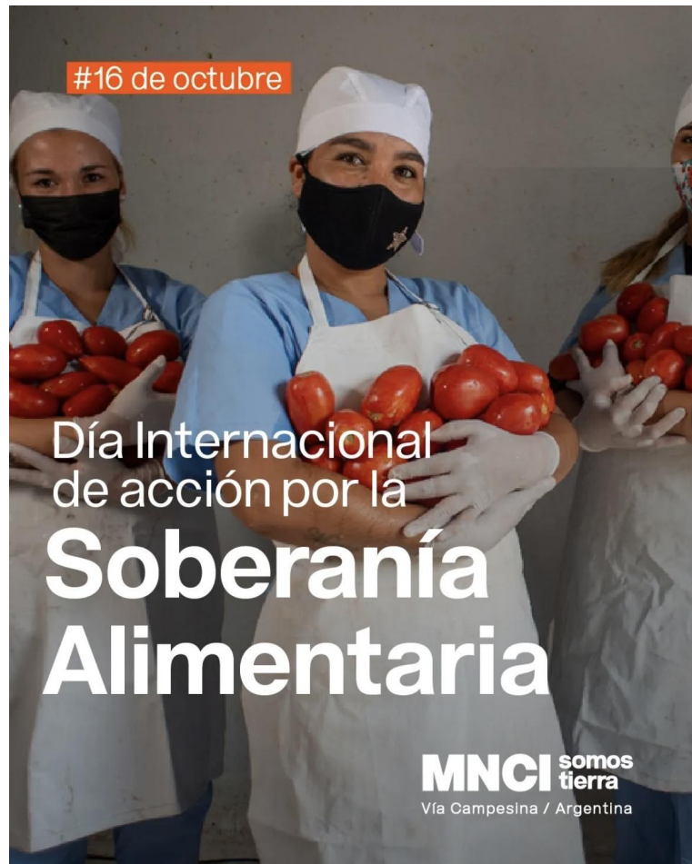
Póster del 16 de octubre del Movimiento Nacional Campesino Indígena, que dice: "Día Internacional de Acción por la Soberanía Alimentaria".

la naturaleza, la cultura y el derecho de los pueblos a decidir qué producir y cómo vivir. Simultáneamente, reiteraron su compromiso con la tierra y la soberanía alimentaria.