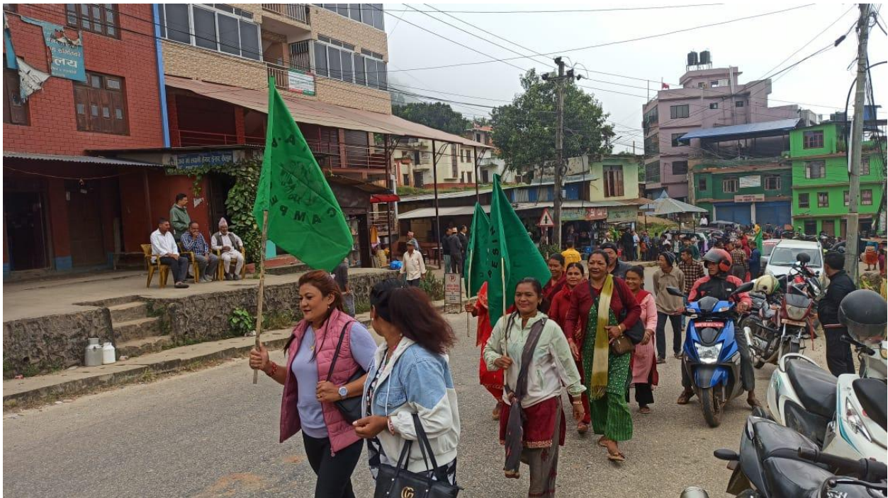
Una marcha a través de Kuntaveshi.