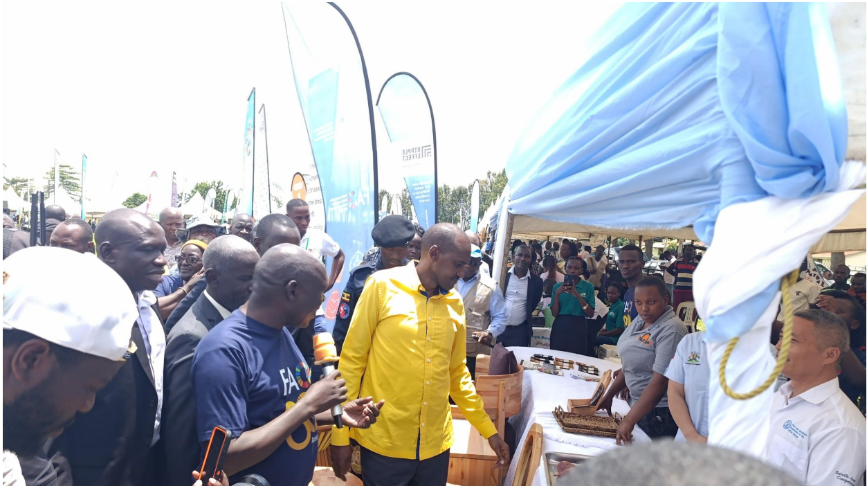
El Honorable Frank Tumwebaze (con camisa amarilla), Ministro de Agricultura, Industria Animal y Pesca, inspeccionando los puestos de exhibición de los pequeños agricultores y agricultoras durante las Celebraciones Nacionales.

De manera similar, el Foro de Pequeños Agricultores Orgánicos de Zimbabwe (ZIMSOFF) conmemoró este día celebrando una Feria de Agroecología y Soberanía Alimentaria en la Escuela de Agroecología de Shashe. La feria introdujo a pequeños agricultores y partes interesadas en las prácticas de agroecología, así como para exhibir la diversidad de semillas y alimentos producidos mientras se nutren los recursos naturales. El evento también permitió demostrar la evidencia y los éxitos de la agroecología y los sistemas de semillas liderados por campesinos y campesinas, promoviendo el discurso político a favor de estos enfoques.