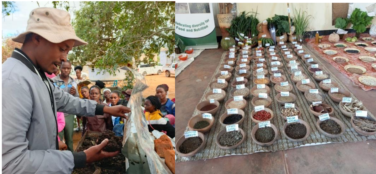
Feria de Agroecología y Soberanía Alimentaria.

Un portavoz de la Autoridad de Gestión Ambiental elogió la vista de distritos libres de barrancos, así como a aquellos y aquellas que continúan preservando las áreas forestales a través de esfuerzos de conservación. La Policía de la República de Zimbabwe también aplaudió la participación de la juventud en Shashe, especialmente como una solución al abuso de drogas y sustancias, así como al crimen.