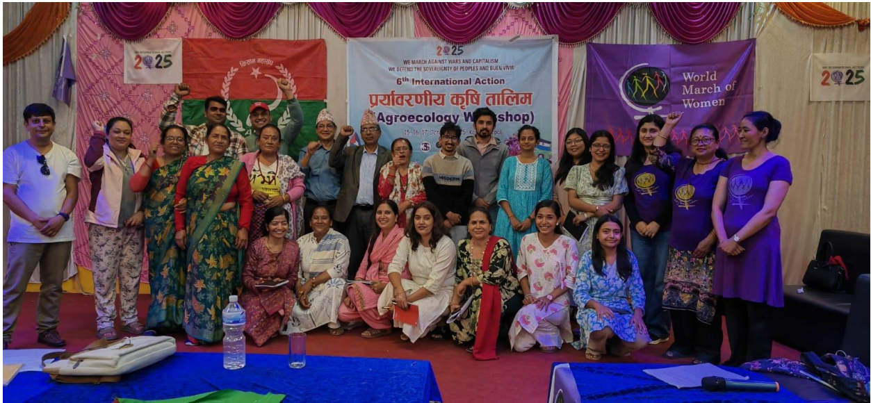
Algunos participantes del taller de Agroecología.