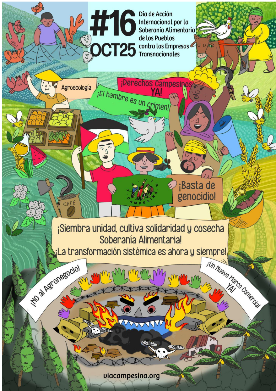
Póster del 16 de octubre.