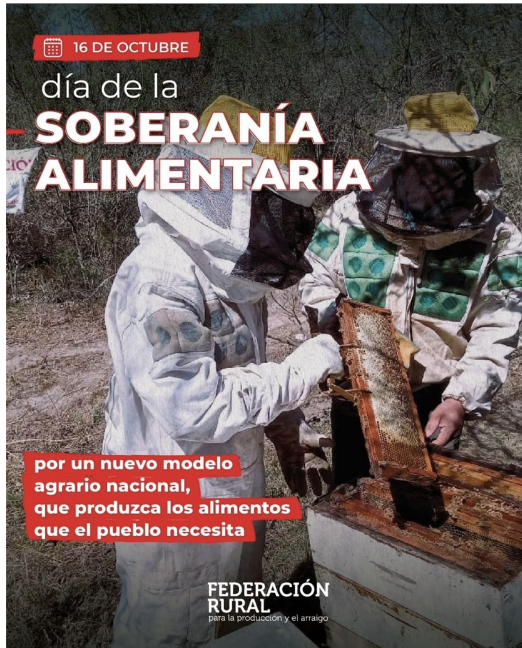
Póster del 16 de octubre de la Federación Rural, que dice: "Día de la Soberanía Alimentaria, por un nuevo modelo agrario nacional que produzca los alimentos que el pueblo necesita".

Además, el Movimiento Nacional Campesino Indígena (MNCI) envió un fuerte mensaje de solidaridad, enfatizando el papel crucial de las voces de las mujeres rurales, campesinas e indígenas debido a su importante rol en el sostenimiento de la vida con sus manos, a través de la siembra, la crianza y la alimentación del pueblo. La organización destacó la violencia perpetrada por grandes entidades del agronegocio en varias provincias, así como a las poblaciones indígenas y campesinas que se oponen al despojo y la criminalización, salvaguardando lo más sagrado: la tierra, el agua, las semillas y la vida. Recalaron cómo sus comunidades permanecen organizadas, trabajando colectivamente y demostrando que otro modelo es posible, uno que respete