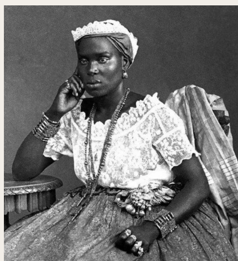
松比和阿夸尔图纳。

16世纪至19世纪期间，非洲人民遭到奴役，超过400万人被强行运到巴西境内，巴西因此成为世界上第二大非洲裔国家。在反抗奴役的过程中，许多人一起逃亡，组织抵抗和共同生存，形成了基隆博。一些基隆博成为组织有序的社区，远离城市。除了被奴役的非洲人外，基隆博还接纳了土著人和一些逃亡的白人。居民的多样性让每个基隆博都形成了不同的组织形式、策略和文化，但又由于人们的反抗精神，它们在某种程度上又很相似。[5]