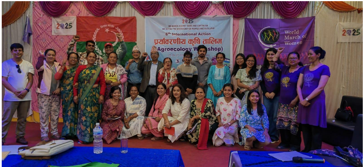
生态农业研讨会部分参与者。

此外，这三家组织还共同为女性农民举办了一场生态农业研讨会，课程内容涵盖病虫害防治、种子与粮食主权、生态农业的原则与种植实践、水土保持，以及女性在农业中的贡献等主题。两项活动均在曼达德布尔市昆塔贝西地区举行，为尼泊尔 7 个省的女性农民及代表搭建了对话、学习与团结的平台。