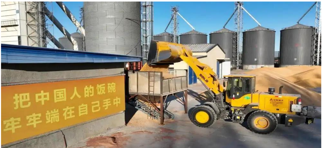
粮食清选，为烘干做准备，中国黑龙江省。

中国实施了多项举措与计划，以巩固国家粮食主权。这些项目包括在山东德州设立为农服务中心，为农民提供粮食烘干与仓储设施；此外，农业农村部在全国范围内调配粮食烘干机，以应对收获季因降雨过多带来的问题。同时，政府还出台了相关政策与行动，以应对农作物的减产。