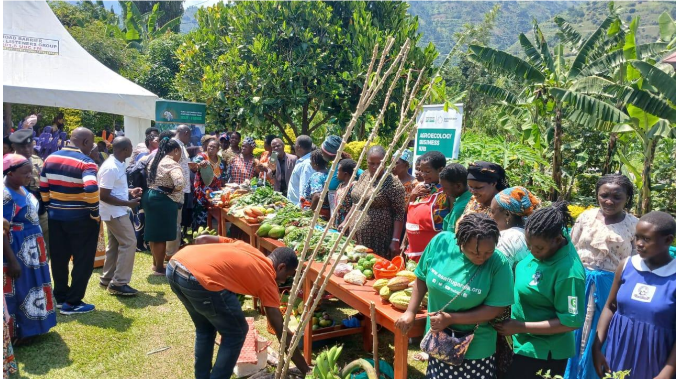
在卡塞西县的社区生态农业学校活动期间，小农们正在展示自家农产品。

粮食体系中的重要作用，呼吁更广泛地推广生态农业，并敦促政府保障女性的土地权利、保护耕地免受洪水和野生动物侵害、提升农产品的价值链增值、规范有害农业投入品，以及向受尼亚姆万巴河洪灾影响的社区提供补偿——这是推动包容和可持续农业的共同呼声。