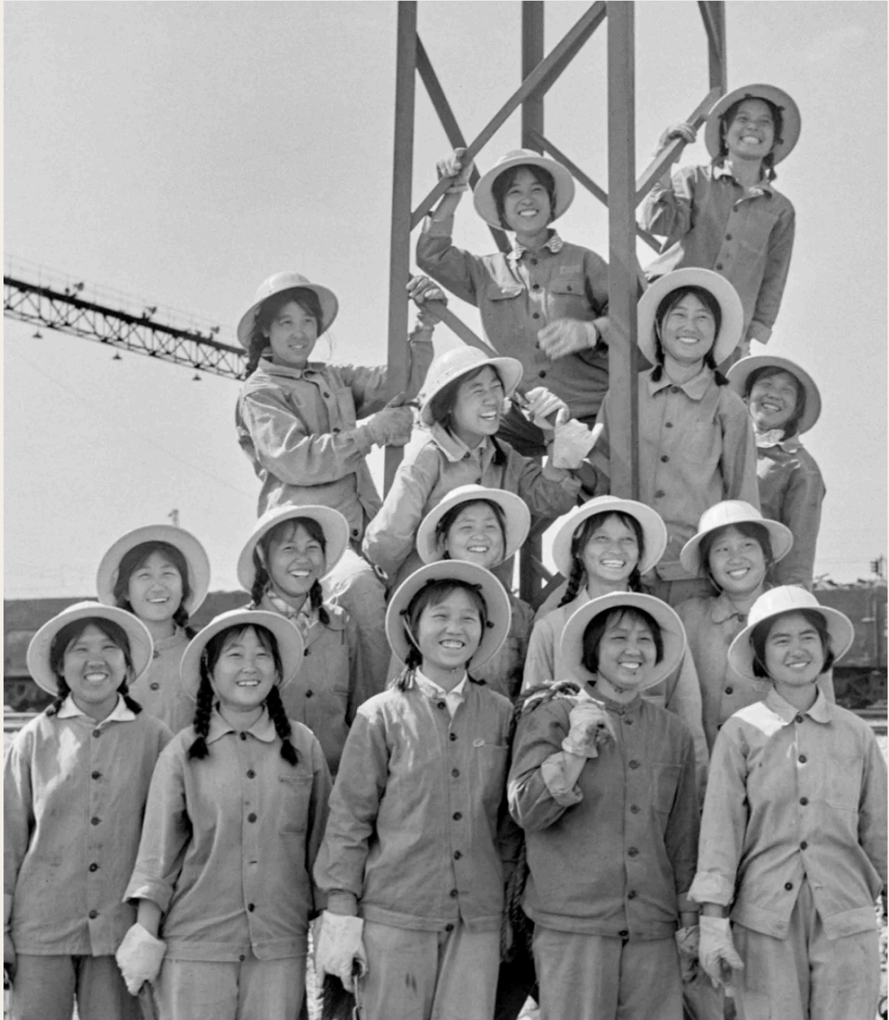
En julio de 1975, trabajadoras de la primera división del cuarto equipo del Departamento de Ingeniería Electroquímica de la Oficina de Ingeniería Electroquímica del Ministerio de Ferrocarriles, participando en el proyecto de construcción de la electrificación del ferrocarril de Baocheng, en la provincia de Sichuan.