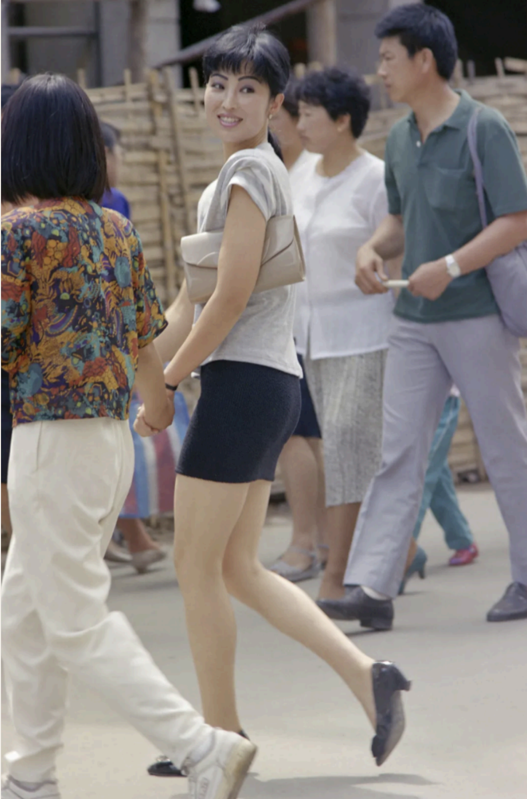
La chica de la falda corta de Dalian refleja el espíritu y la búsqueda estética de las jóvenes de la «capital de la moda del norte» a principios de la década de 1990. La foto, de septiembre de 1991, se ha convertido también en un vivo retrato de los cambios en la cultura social del vestido. En Dalian, provincia de Liaoning.