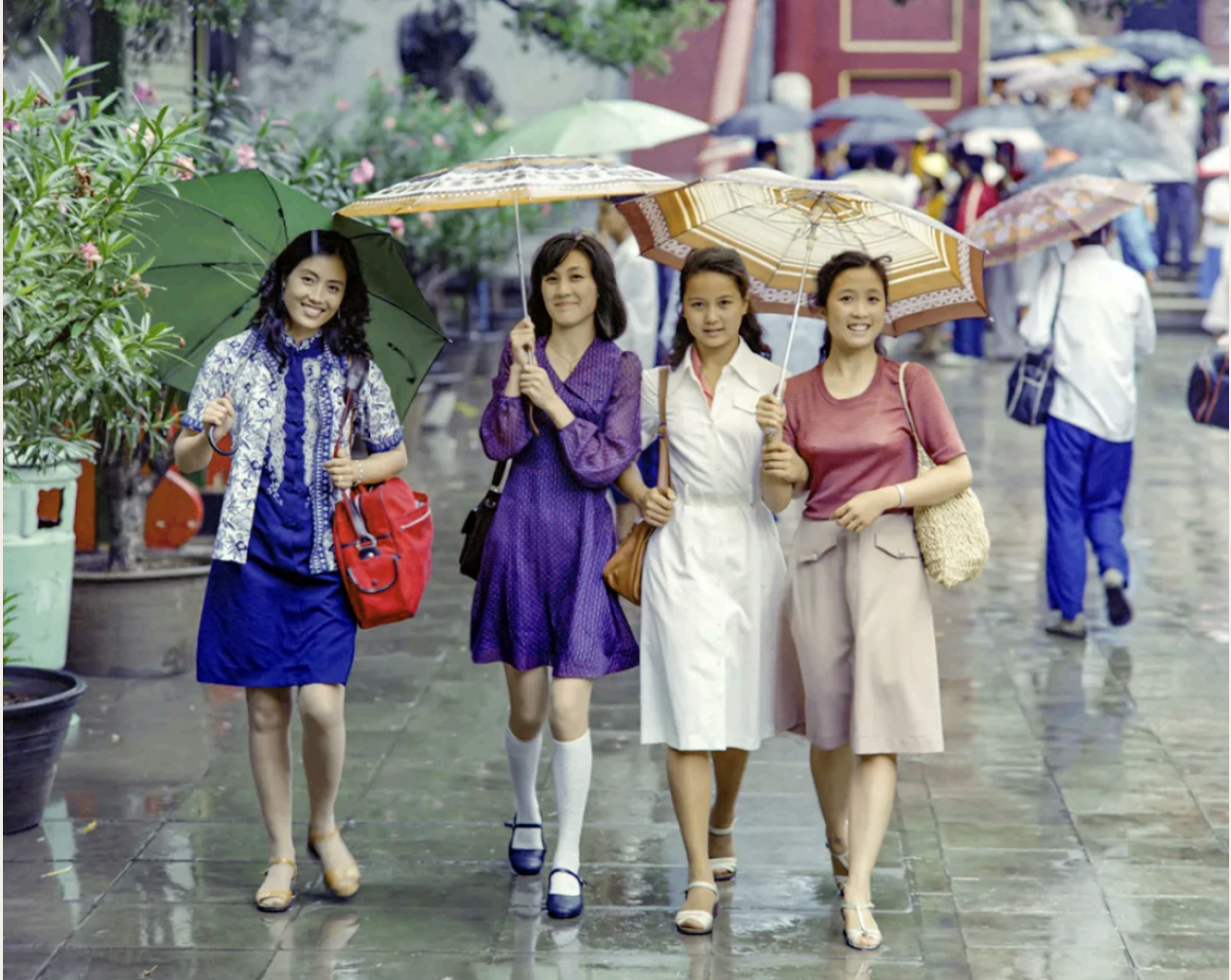
Un lluvioso y brumoso, un grupo de jóvenes llevan ropa a la moda y elegante, convirtiéndose en una vívida nota a pie de página de la cultura popular de los años ochenta.