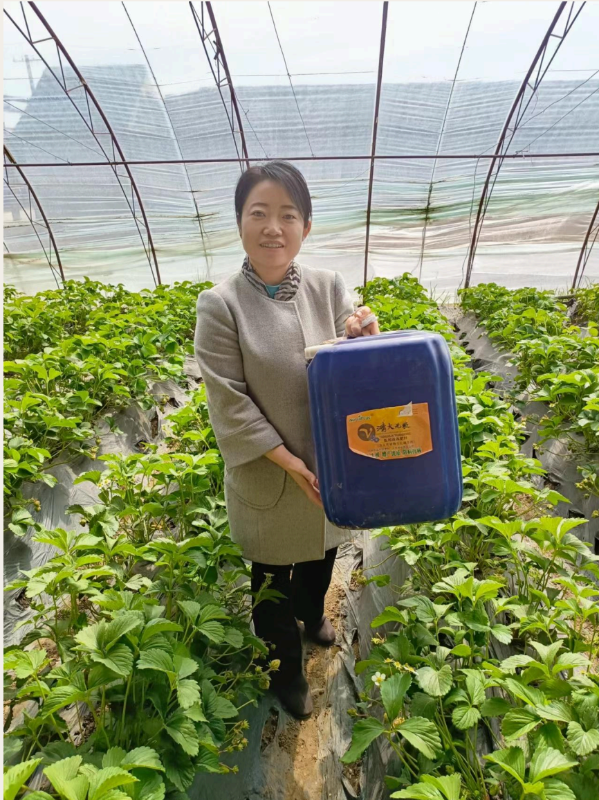
Humus líquido.

Promueve el crecimiento de los cultivos: Sustancias naturales de crecimiento como el ácido indol-3-acético y las giberelinas se disuelven durante el proceso de vermicompostaje, por lo que el humus líquido producido a partir de él tiene un gran efecto de promoción de crecimiento sobre raíces y hojas.