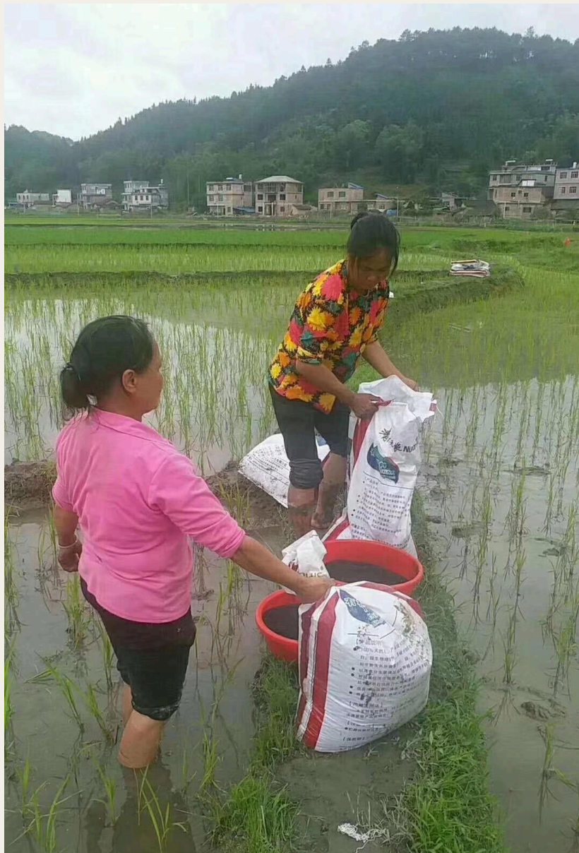
Agricultoras aplicando abonos a base de vermicompost.

desconocidos, que promueven la división de las células vegetales y regulan el crecimiento de las plantas.