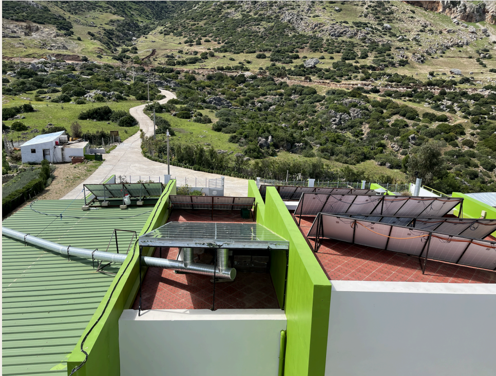
太阳能电池板与空气源热泵。

然而,该地区面临多重社会经济挑战,长期贫困和高辍学率仍然是亟待解决的问题。土地资源有限,制约了农业生产,常常迫使许多家庭出售土地并迁往城市。由于农村学校缺乏寄宿设施,女孩在接受教育方面面临较大障碍。此外,日益上涨的交通费用以及根深蒂固的性别观念在很大程度上也限制了她们出行和发展机会。