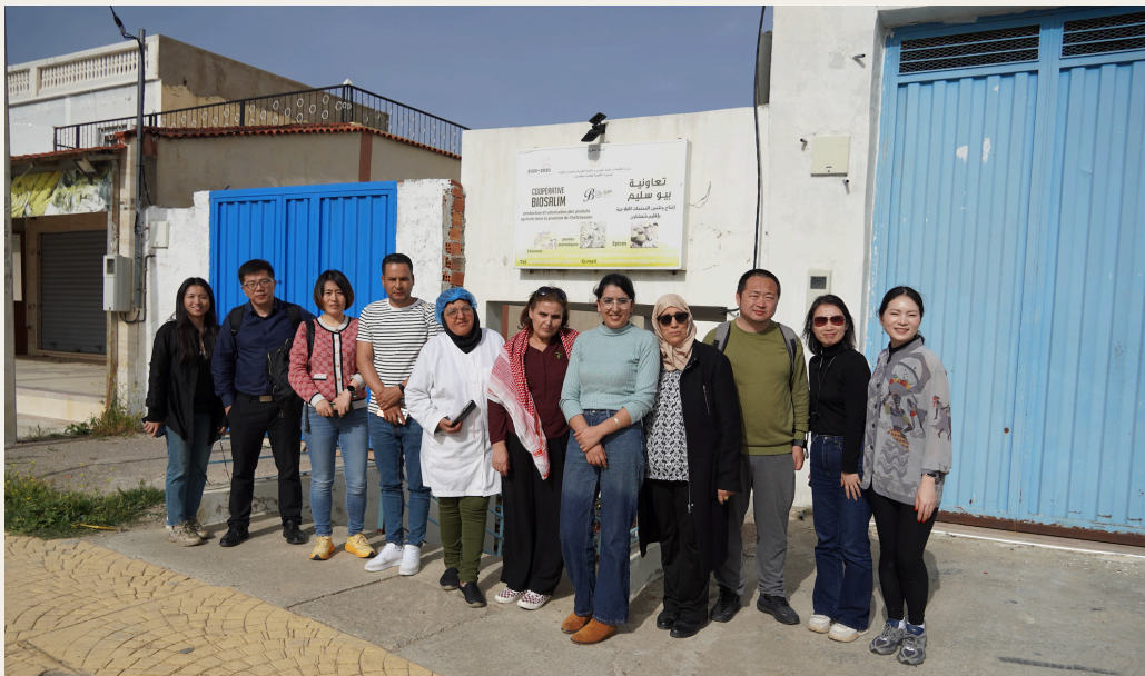
Biosalim合作社成员与中国代表团合影。

然而，与许多山区农村合作社一样， Biosalim 仍面临将产品推向更广阔市场的现实挑战，但这并未动摇成员们的信念。相反，合作社成员始终以坚韧与恒心迎难而上，展现出温柔却有力的集体力量。 Biosalim 合作社不仅是一个生产实体，更是一段关于女性力量、本土智慧与可持续理念深深扎根土地的真实故事。