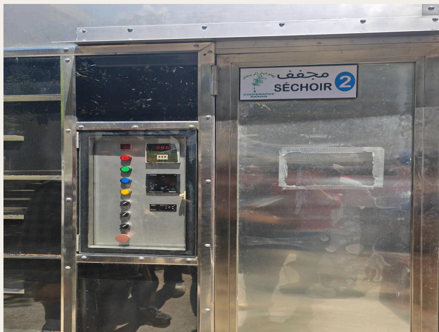
太阳能干燥室控制器。

Raihan合作社采用316L不锈钢蒸馏设备进行提取，该设备是摩洛哥北部唯一的户外蒸馏系统且设备的结构坚固耐用，不仅确保了高品质的提取效果，还能灵活应对季节性生产的变化需求。