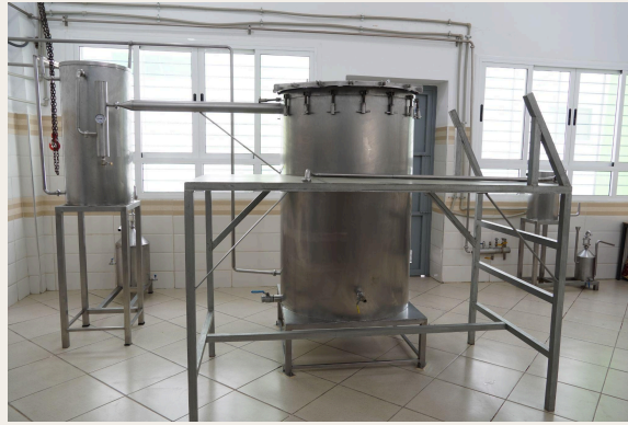
蒸馏系统和冷压设备。

加工完成后, 产品经过精心包装, 被妥善储存。Aghssane合作社还设有一个小型实验室, 用于质量控制和产品研发, 同时经营一家零售店, 直接销售其草本和美妆类的增值产品。