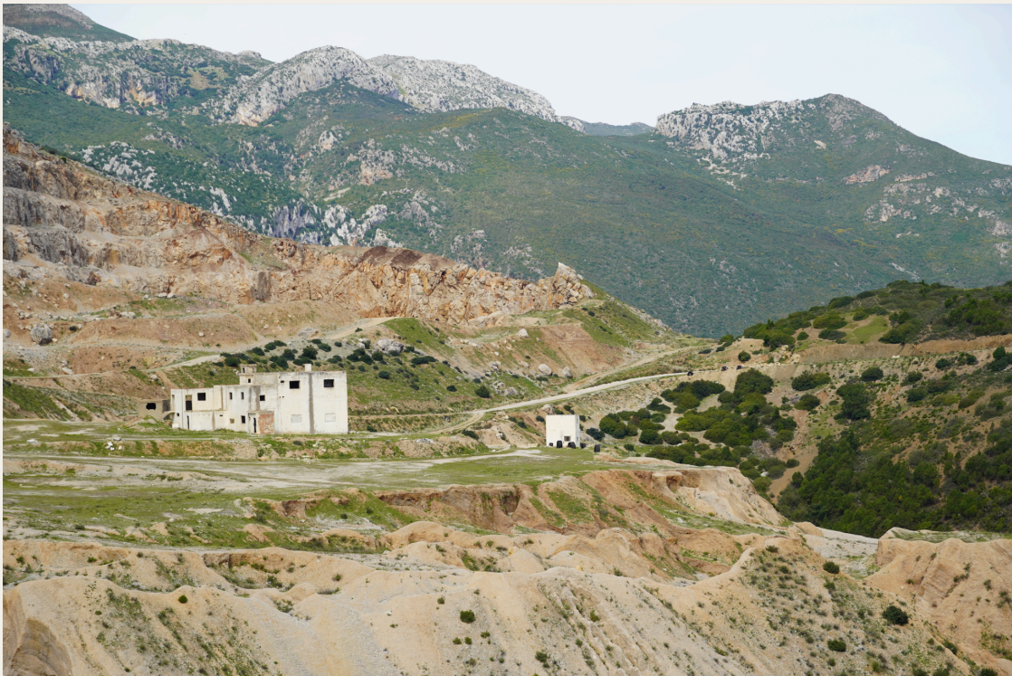
屋顶露台全景视野。