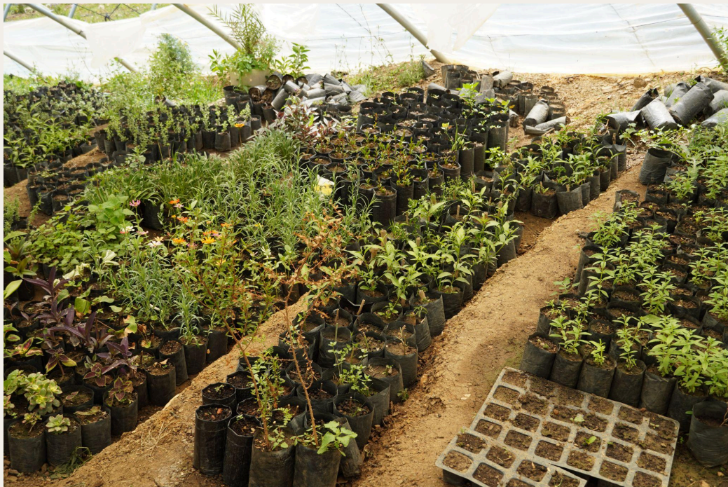
育苗温室。

其他基础设施还包括育苗温室、水储罐和废水滞留池，充分展现了合作社对生态可持续发展的高度重视。