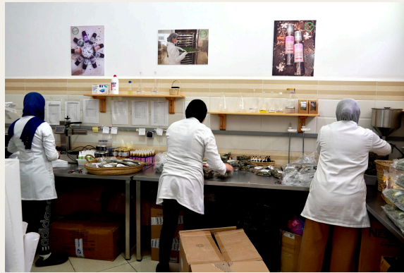
现场包装与储存设施。

加工完成后, 产品经过精心包装, 被妥善储存。Aghssane合作社还设有一个小型实验室, 用于质量控制和产品研发, 同时经营一家零售店, 直接销售其草本和美妆类的增值产品。