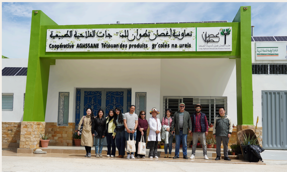
Aghssane合作社成员与中国代表团合影。

然而,该地区面临多重社会经济挑战,长期贫困和高辍学率仍然是亟待解决的问题。土地资源有限,制约了农业生产,常常迫使许多家庭出售土地并迁往城市。由于农村学校缺乏寄宿设施,女孩在接受教育方面面临较大障碍。此外,日益上涨的交通费用以及根深蒂固的性别观念在很大程度上也限制了她们出行和发展机会。