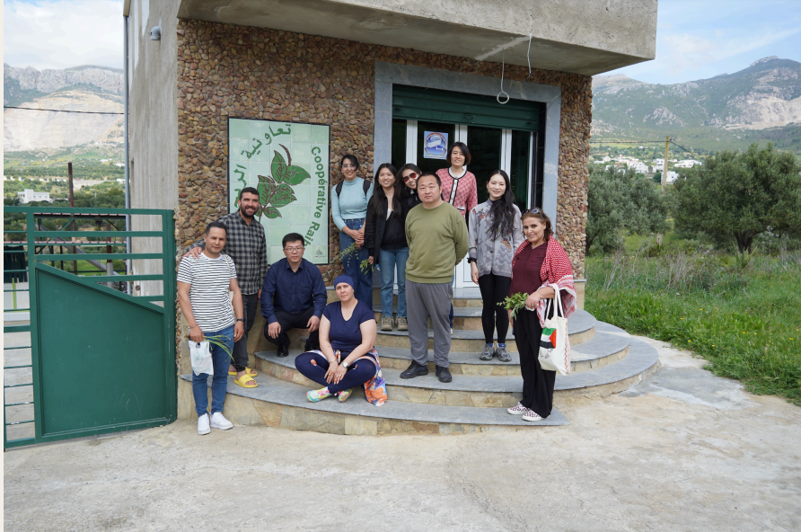
Raihan合作社成员与中国代表团合影。

坐落于摩洛哥阿特拉斯山脉山脚下的 Raihan合作社 ，诞生并非出于商业追求，而是源于一家人对土地与传统的深厚情感与共同愿景。从最初的梦想出发，它已成长为摩洛哥北部最具代表性的可持续家庭式农村企业模式之一。