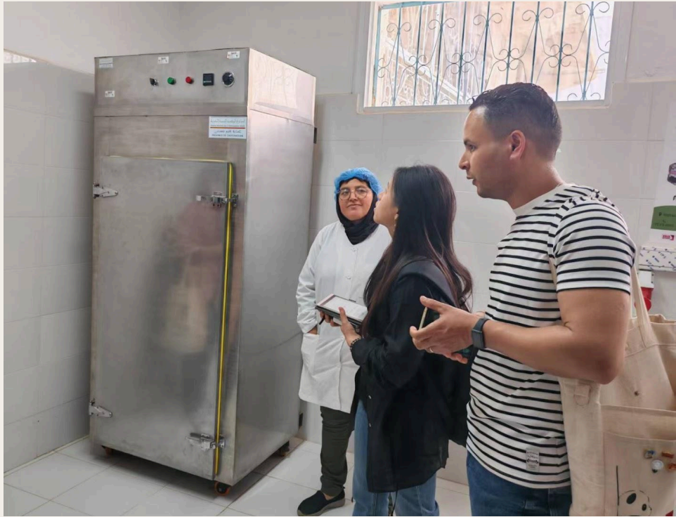
参观生产车间。