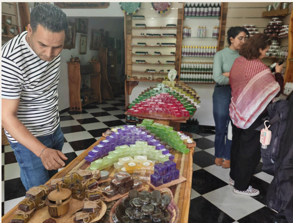
零售店内产品。

太阳能干燥室采用黑色吸光板与玻璃墙体设计,既能高效蓄热,又能有效保留娇嫩植物的色泽与特性。干燥室配备外部电表及四区域温度显示系统(上层温度为 45^{\circ}\text{C} ,下层为 49^{\circ}\text{C} ),确保不同类型植物在最佳条件下进行干燥处理。