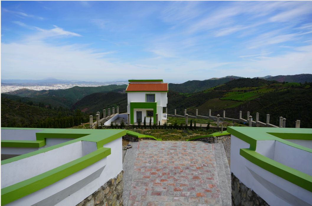
屋顶露台全景视野。

其他基础设施还包括育苗温室、水储罐和废水滞留池，充分展现了合作社对生态可持续发展的高度重视。