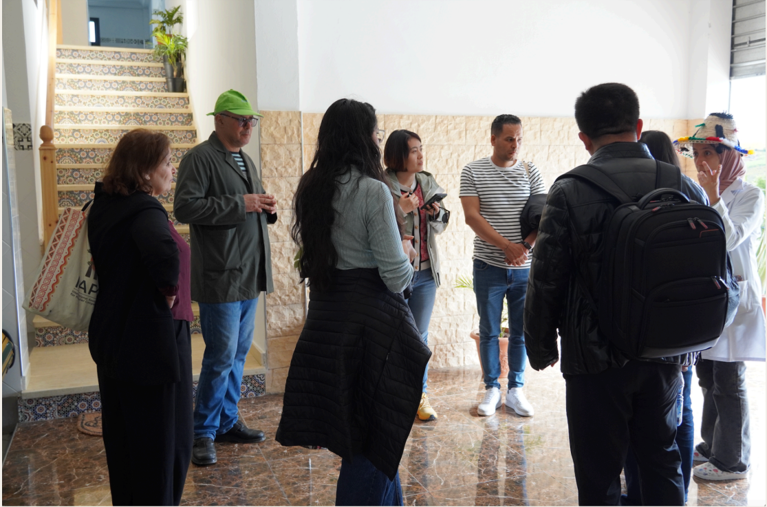
公共区域合影。