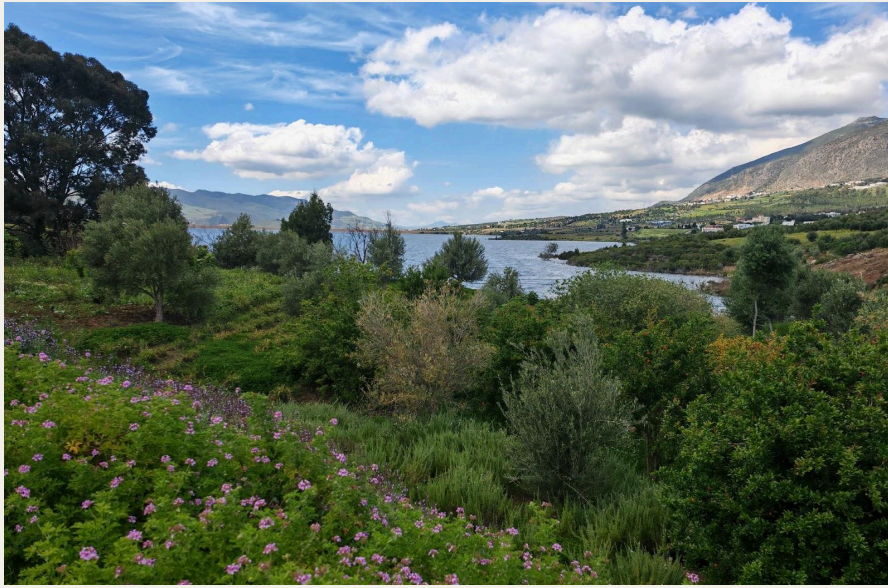
合作社种植区域。

多年来, Raihan 合作社不断发展壮大, 逐步提升了其规模与知名度。目前, 合作社已获得本地有机认证、欧盟生态 ( Ecocert ) 认证, 并具备产品出口资质。成员除享有固定月薪外, 还可获得绩效激励, 在当地社区中处于较高收入水平, 有效激发了工作积极性, 增强了团队的责任感与归属感。