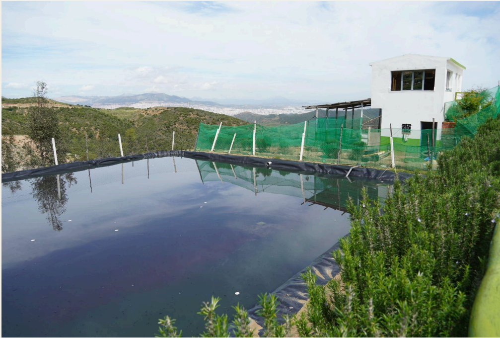
水储罐和废水滞留池。