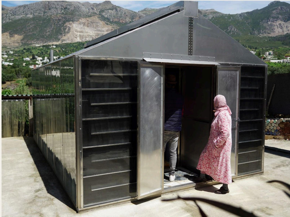
太阳能干燥室。