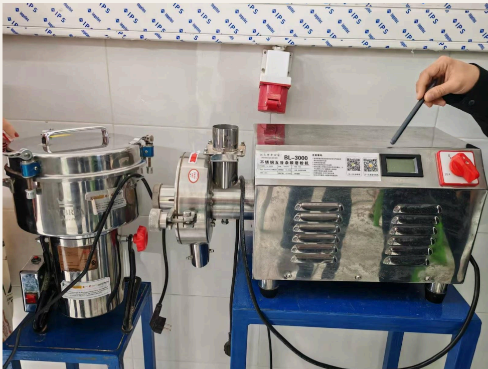
研磨机和粉碎机。