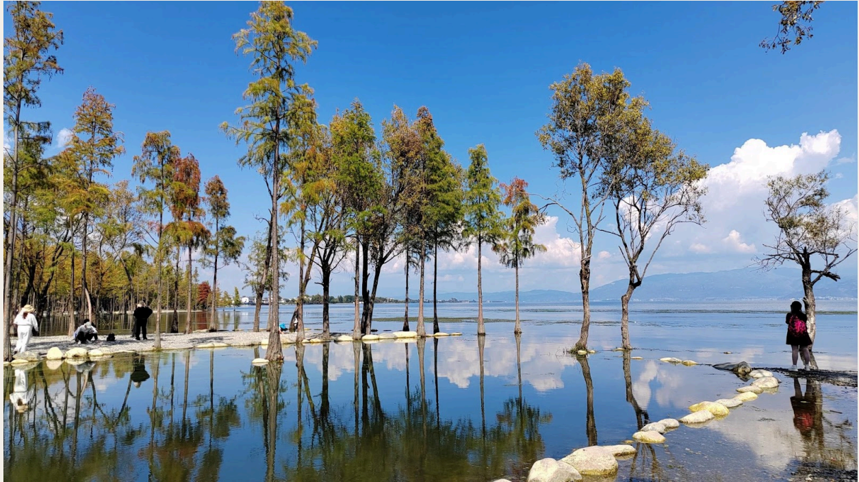
El paisaje del lago Erhai tras su saneamiento. Fuente: Dianping [4]

ecológica como para el desarrollo económico, es totalmente alcanzable a través del empoderamiento tecnológico, el apoyo al talento, el desarrollo ecológico de las industrias y la industrialización de la ecología, y la colaboración multipartita.