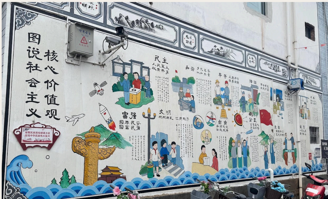
Gusheng Village Mural—Illustrating the Core Socialist Values [17].

La construcción del Partido ha desempeñado un papel clave en este sistema colaborativo. La organización del Partido coordina los recursos de todos los actores para garantizar una cooperación fluida y eficiente. Los miembros del Partido que son expertos técnicos actúan como pioneros y modelos a seguir, alentando a los agricultores a adoptar nuevas tecnologías e ideas. La Liga de la Juventud Comunista ha movilizado a jóvenes voluntarios, especialmente a estudiantes universitarios de la Residencia, para llevar a cabo activamente más de 20 campañas de concienciación ambiental y actividades de promoción tecnológica, inculcando el concepto de 'civilización ecológica' en el corazón de la gente. Esta combinación de un 'motor rojo' y un 'desarrollo verde' ha inyectado un fuerte impulso a la revitalización rural.