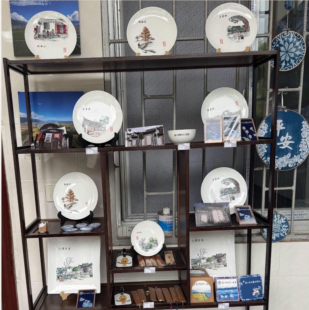
Productos culturales y creativos diseñados por los profesores y estudiantes de la Residencia.

generación más joven se ha trasladado a las ciudades costeras en busca de oportunidades de desarrollo, mientras que la generación mayor se dedica a labores como la vigilancia y el mantenimiento de los campos dentro de la aldea. Todos han encontrado su lugar en esta transformación.