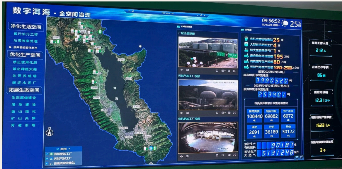
Erhai Digital · Un sistema de macrodatos para la gobernanza espacial integral.

mientras que Shunfeng Erhai es responsable de convertir estos logros tecnológicos en producción a gran escala. A través de la innovación tecnológica continua, han logrado verdaderamente el objetivo de la economía circular de 'convertir los residuos en un tesoro'. Este modelo de profunda integración entre industria, universidad e investigación permite una conexión sin fisuras entre la cadena de innovación y la cadena industrial.