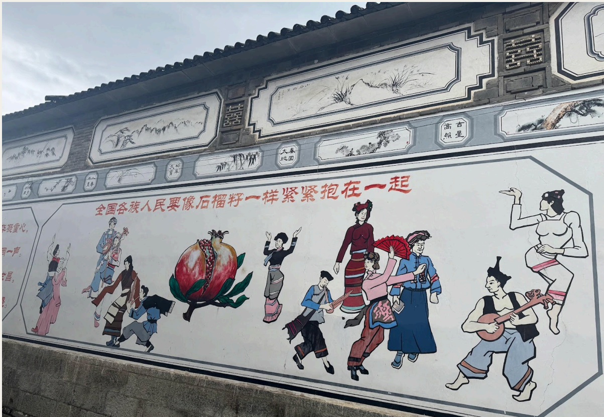
Mural de la aldea de Gusheng—Todos los grupos étnicos de China deben mantenerse firmemente unidos, como las semillas de una granada.

constante en el estándar de Clase II[18], restaurando el paisaje poético descrito como: «Las montañas Cangshan son una pintura atemporal sin tinta, y el lago Erhai es una cítara eterna sin cuerdas».