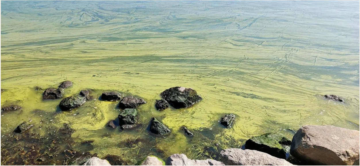
El lago Erhai durante un florecimiento de algas azules.

Para salvar al Lago Madre, el gobierno local implementó la política de «Tres Prohibiciones y Cuatro Promociones»[3], la más estricta de su historia. Esta política prohibía el uso de fertilizantes y pesticidas químicos, el cultivo de productos que requerían fertilización intensiva y la ganadería y avicultura a gran escala. Al mismo tiempo, promovía la siembra ecológica, el aprovechamiento de los residuos agrícolas, las medidas de ahorro de agua y la compensación ecológica. Sin embargo, bajo estas estrictas medidas ambientales, ¿cómo iban a ganarse la vida los agricultores que habían perdido sus métodos de cultivo tradicionales? Con la transferencia de todas las tierras en un perímetro de tres kilómetros alrededor del Erhai, ¿cómo se adaptarían a nuevos roles los aldeanos que habían cultivado la tierra por generaciones? Esta difícil elección, conocida como el «Dilema del Erhai», puso a prueba la sabiduría de todas las partes implicadas.