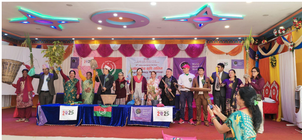
Cenas do Workshop de Agroecologia.

Em um esforço colaborativo, a Marcha Mundial das Mulheres – Nepal, Sristi Sewa Semaj e a Federação de Camponeses de Todo o Nepal organizaram um programa de 3 dias que culminou em uma manifestação de centenas de mulheres, camponeses e jovens ativistas. Eles marcharam e reivindicaram paz, direitos à terra e um mundo livre da fome. A manifestação ressaltou a interconexão entre soberania alimentar e paz, enfatizando que o direito à alimentação e à terra forma a base da justiça social e do desenvolvimento sustentável.