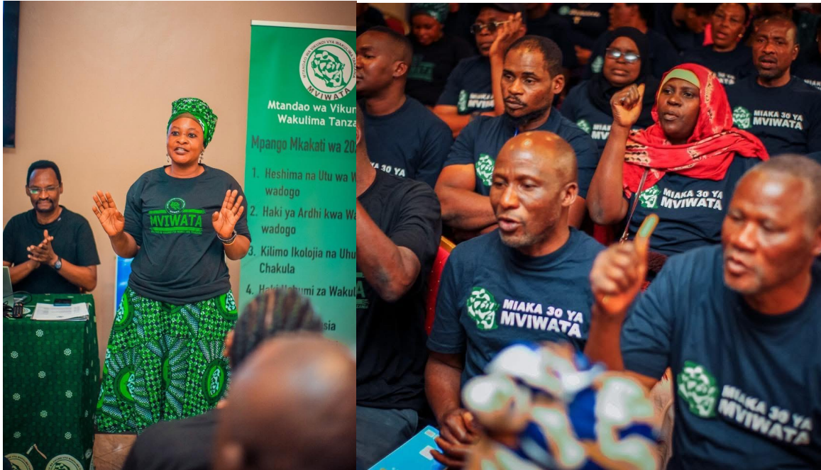
Reunião do Conselho na sede da MVIWATA, em Morogoro.