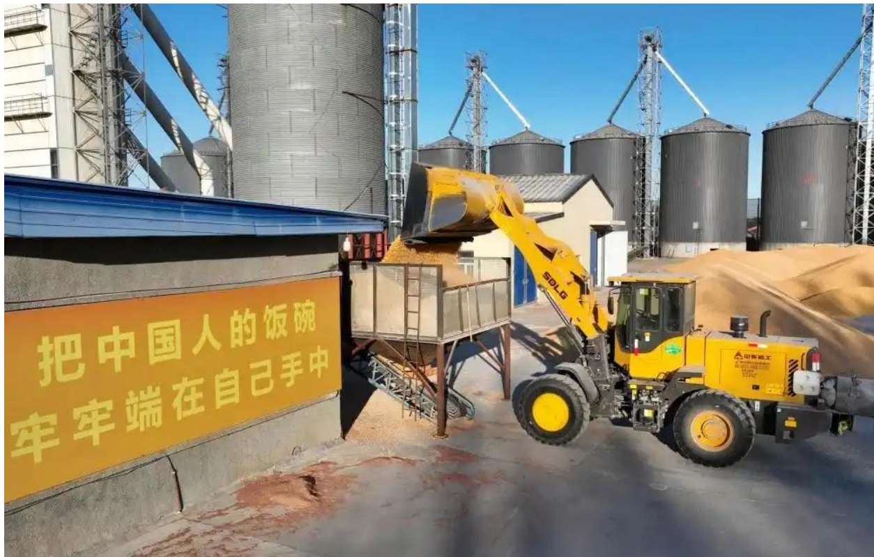
Classificação de grãos como etapa prévia à secagem. O slogan na parede diz: “O abastecimento alimentar do povo chinês está firmemente em suas próprias mãos.” Província de Heilongjiang, China.

Uma variedade de iniciativas e programas foi implementada na China para fortalecer a soberania alimentar do país. Esses projetos incluíram o estabelecimento de um centro de serviços para agricultores em Dezhou, Shandong, que permite aos agricultores utilizar instalações de secagem e armazenamento. Além disso, o Ministério da Agricultura e Assuntos Rurais distribuiu secadores de grãos em todo o país para enfrentar as dificuldades causadas pelo excesso de chuvas durante a época de colheita. Também estão incluídas as políticas e iniciativas implementadas pelo governo para tratar da questão das perdas de colheitas, entre outras coisas.