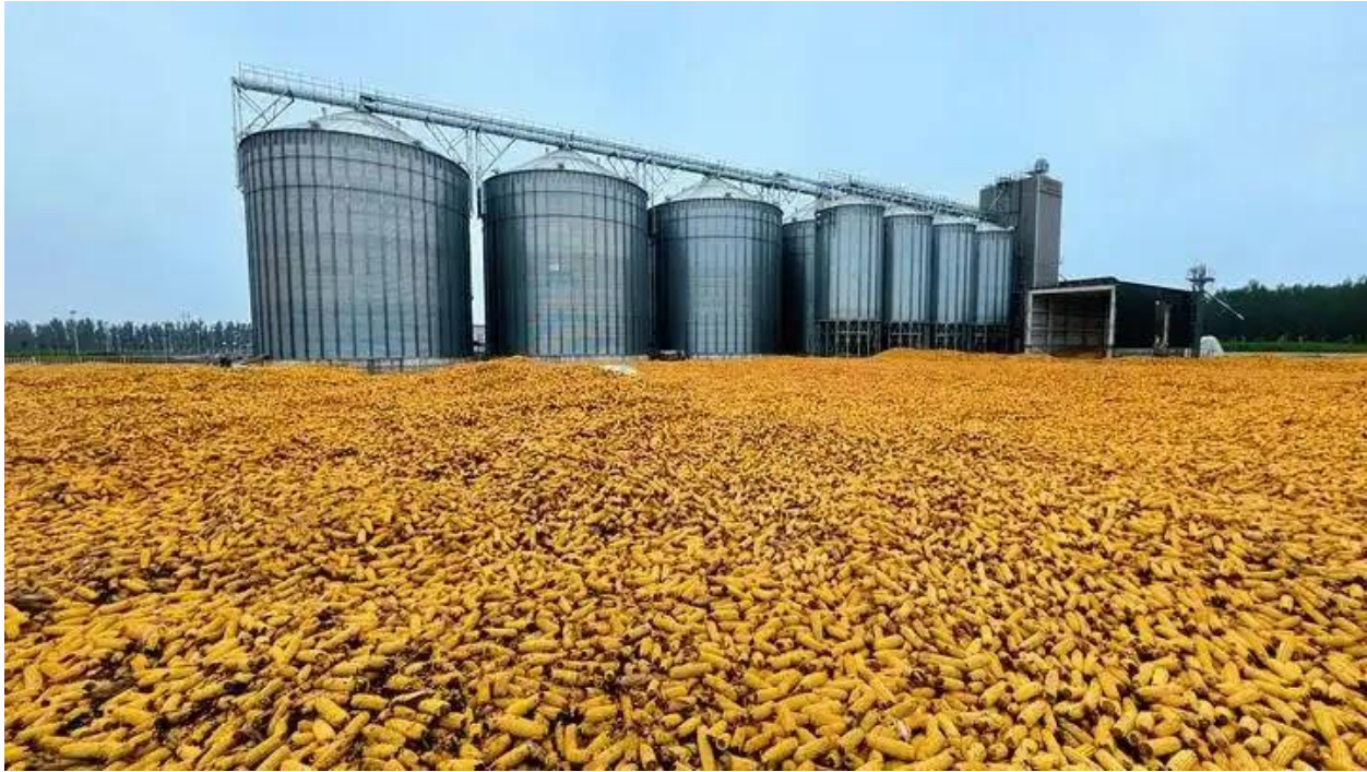
Centro de Serviços para Agricultores em Encheng, Condado de Pingyuan, Cidade de Dezhou, Província de Shandong. O centro possui um grande equipamento de secagem e 9 silos de grãos padronizados, que fornecem serviços de secagem e compra de milho para os agricultores locais.