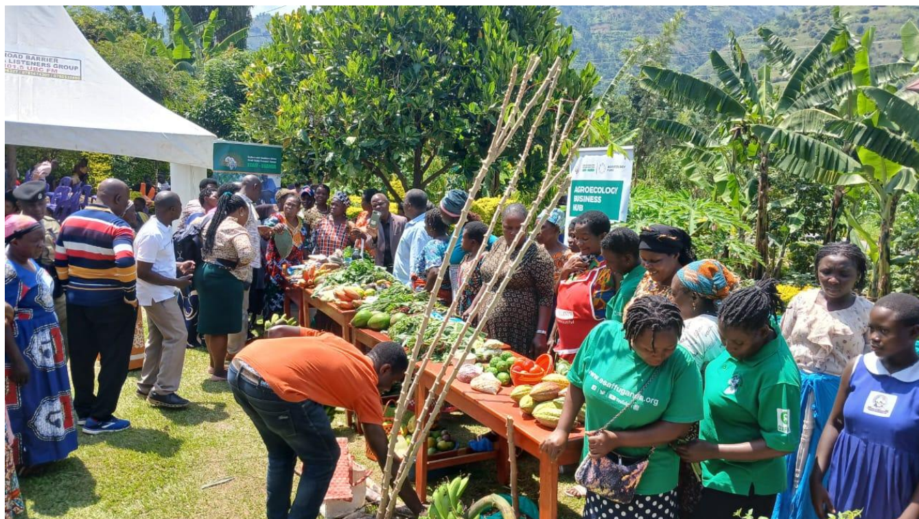
Pequenos agricultores exibindo seus produtos durante o evento na Kisanga CAS em Kasese.

Além disso, por meio de apresentações artísticas, os Clubes de Agroecologia das escolas apoiadas pela ESAFF Uganda utilizaram a poesia para evidenciar a agroecologia e a soberania alimentar, representando o envolvimento da juventude no movimento por sistemas alimentares sustentáveis. A organização também participou das celebrações nacionais na cidade de Fort Portal, em Uganda, onde expôs produtos cultivados agroecologicamente e variedades de sementes manejadas por agricultores da sua rede de pequenos produtores. As exposições destacaram as alternativas concretas que as comunidades estão construindo: alimentos seguros, nutritivos e cultivados em harmonia com a natureza.