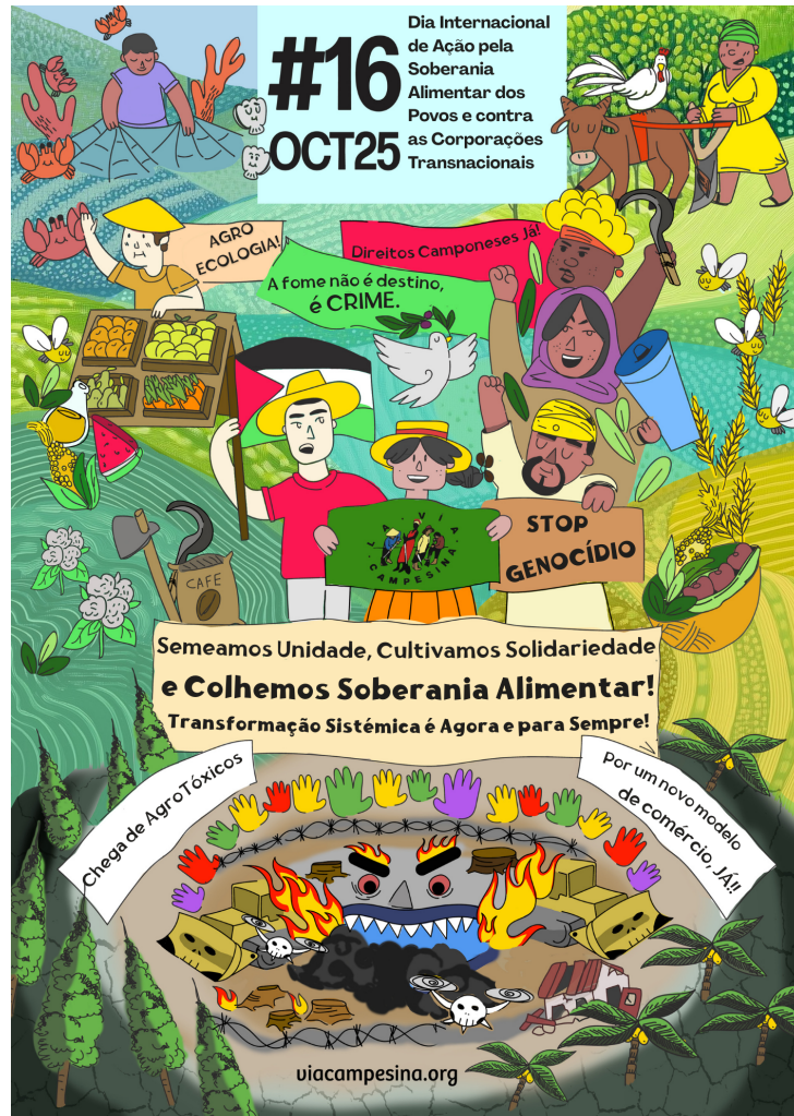
Pôster de 16 de outubro.