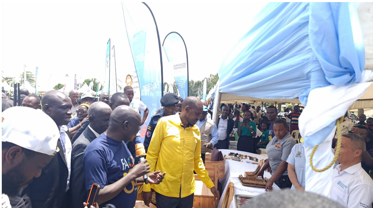
Hon. Frank Tumwebaze (de camisa amarela), Ministro da Agricultura, Indústria Animal e Pesca, inspecionando estandes da exposição pelos pequenos agricultores durante as Celebrações Nacionais.