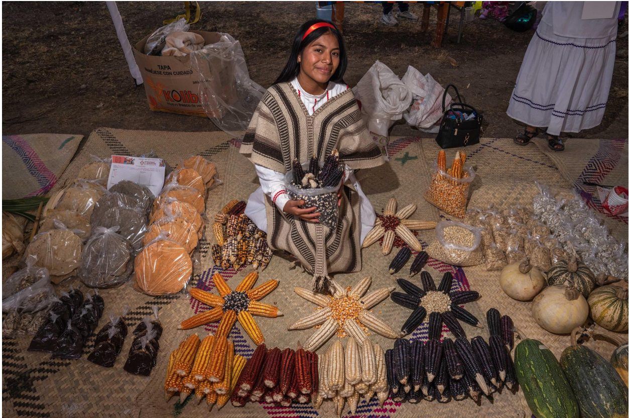
Uma exposição de produtos agrícolas.

básicas como milho, feijão, amaranto e abóbora na dieta mexicana. Essas iniciativas visam fortalecer a economia local enquanto garantem que a população tenha acesso a alimentos nutritivos de origem nacional.