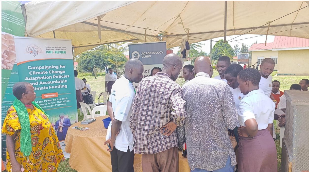
Participantes inspecionam estandes da exposição.