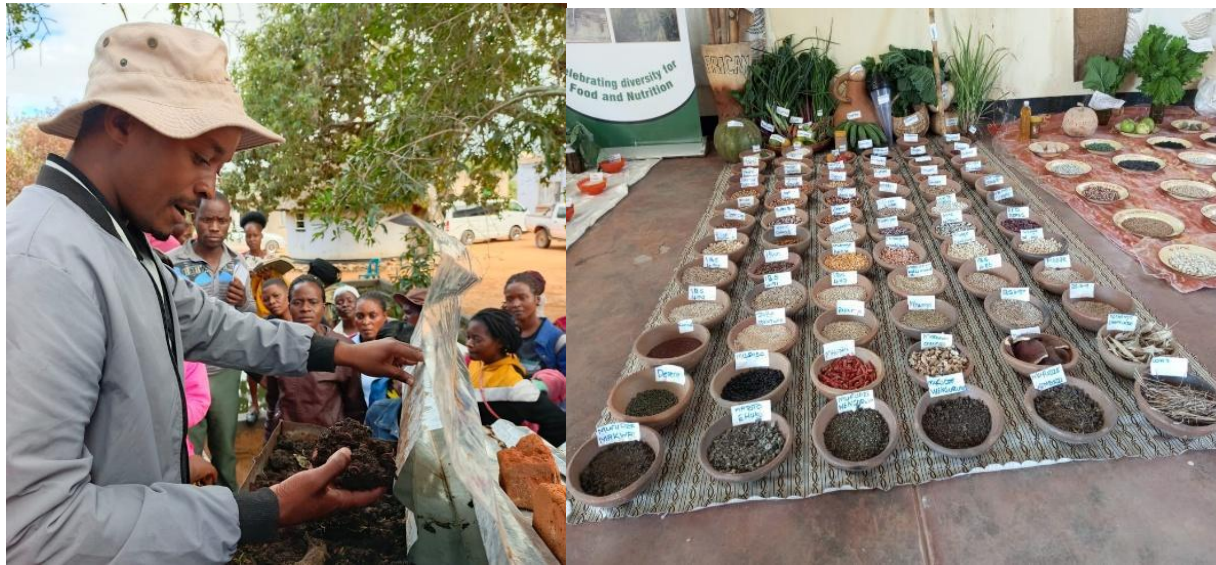
Feira de Agroecologia e Soberania Alimentar.

Além disso, membros da Rede Nacional de Grupos de Pequenos Agricultores na Tanzânia (Mtandao wa Vikundi vya Wakulima Tanzania - MVIWATA) convocaram uma reunião do conselho e se juntaram a pequenos agricultores globalmente para observar este dia significativo. A reunião, realizada na sede da MVIWATA em Morogoro, reuniu seus membros de diferentes regiões.