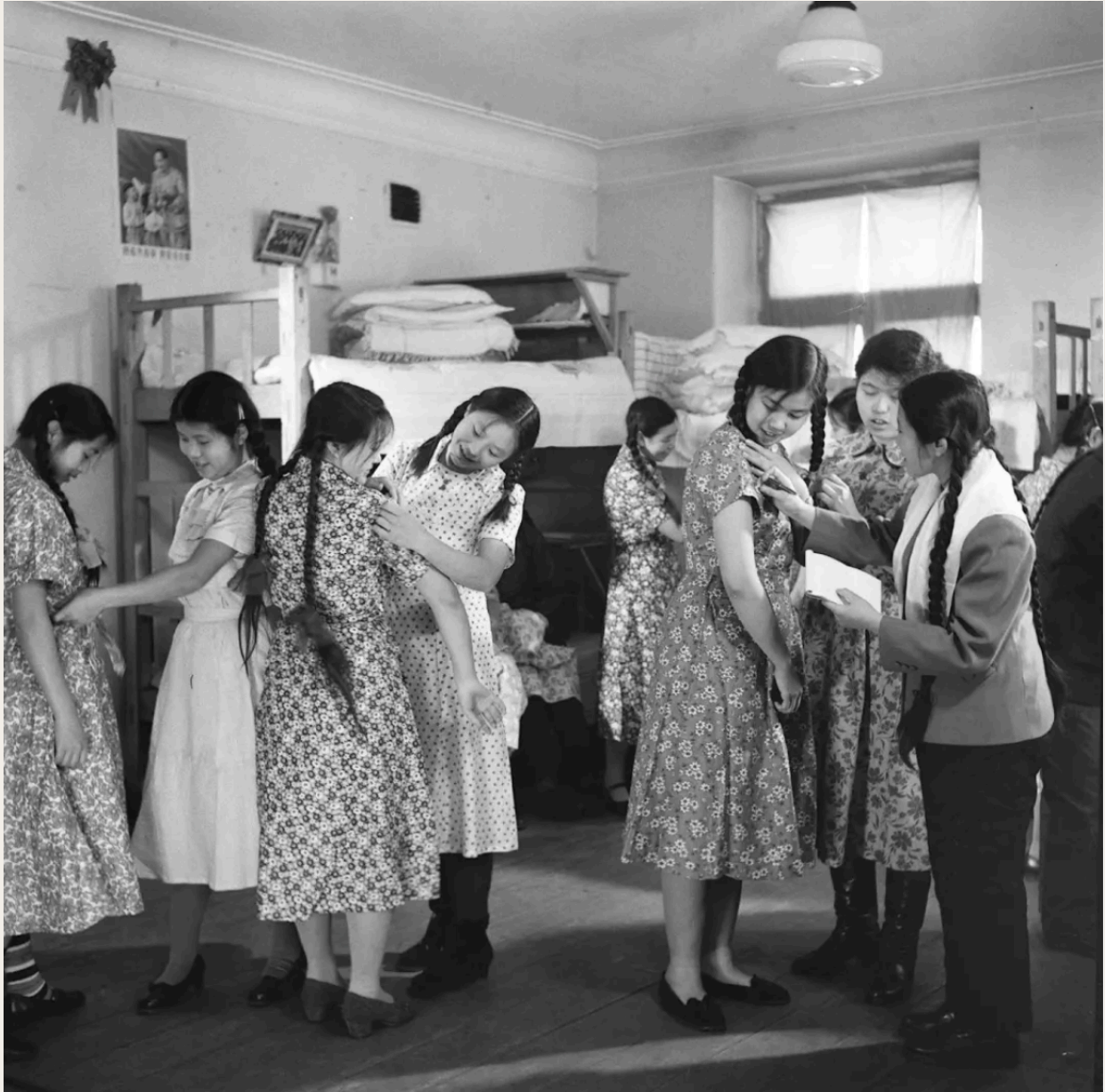
爱美的青年女工试衣的模样欢喜又陶醉。式样相同、图案各异的“布拉吉”如繁花盛开，青春之美，欣然绽放。1950年代，黑龙江哈尔滨亚麻纺织厂的女工在试穿“布拉吉”。新华社记者 胡伟 摄。