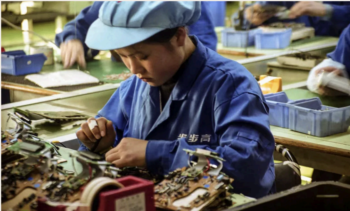
画面细节丰富，现场光线对主体形成柔和照明。人物神情专注而坚定，仿佛在与时间赛跑，充满力量和希望。2000年2月，广东东莞长安镇一家电子有限公司生产线上的女工。新华社发。