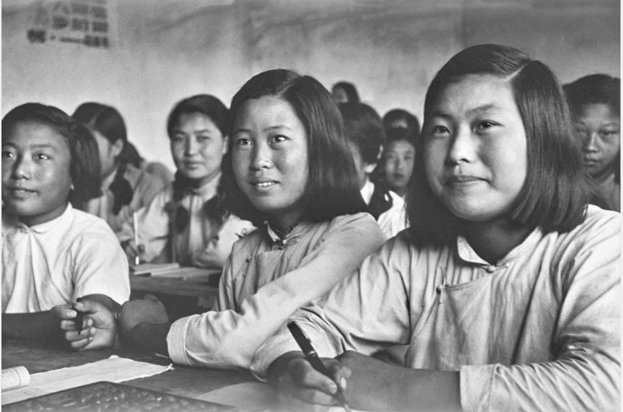
主人公表情纯真，斜襟棉布上衣显示服饰时代特点，展现女性的端庄简素。1950年7月，河北唐山滦南县的妇女在人民文化馆学习文化。20世纪50年代，斜襟棉布上衣是中国农村女性常穿的服装。