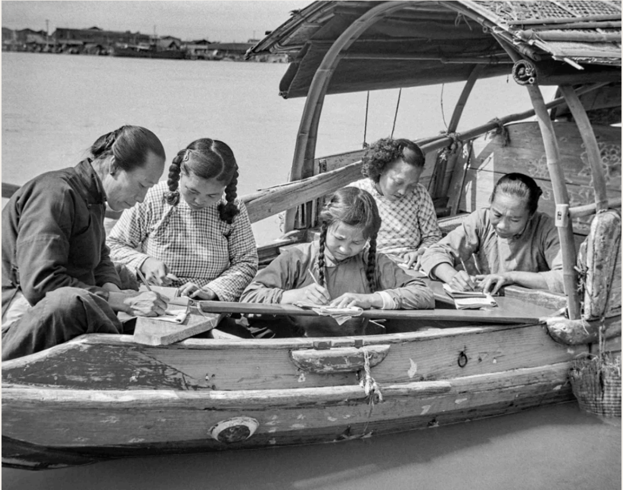
画面信息丰富，不同年龄的女性神情专注，“水上书房”的环境为画面增加更多趣味。1958年，参加“扫盲”的福建福州水上居民在练习写字。