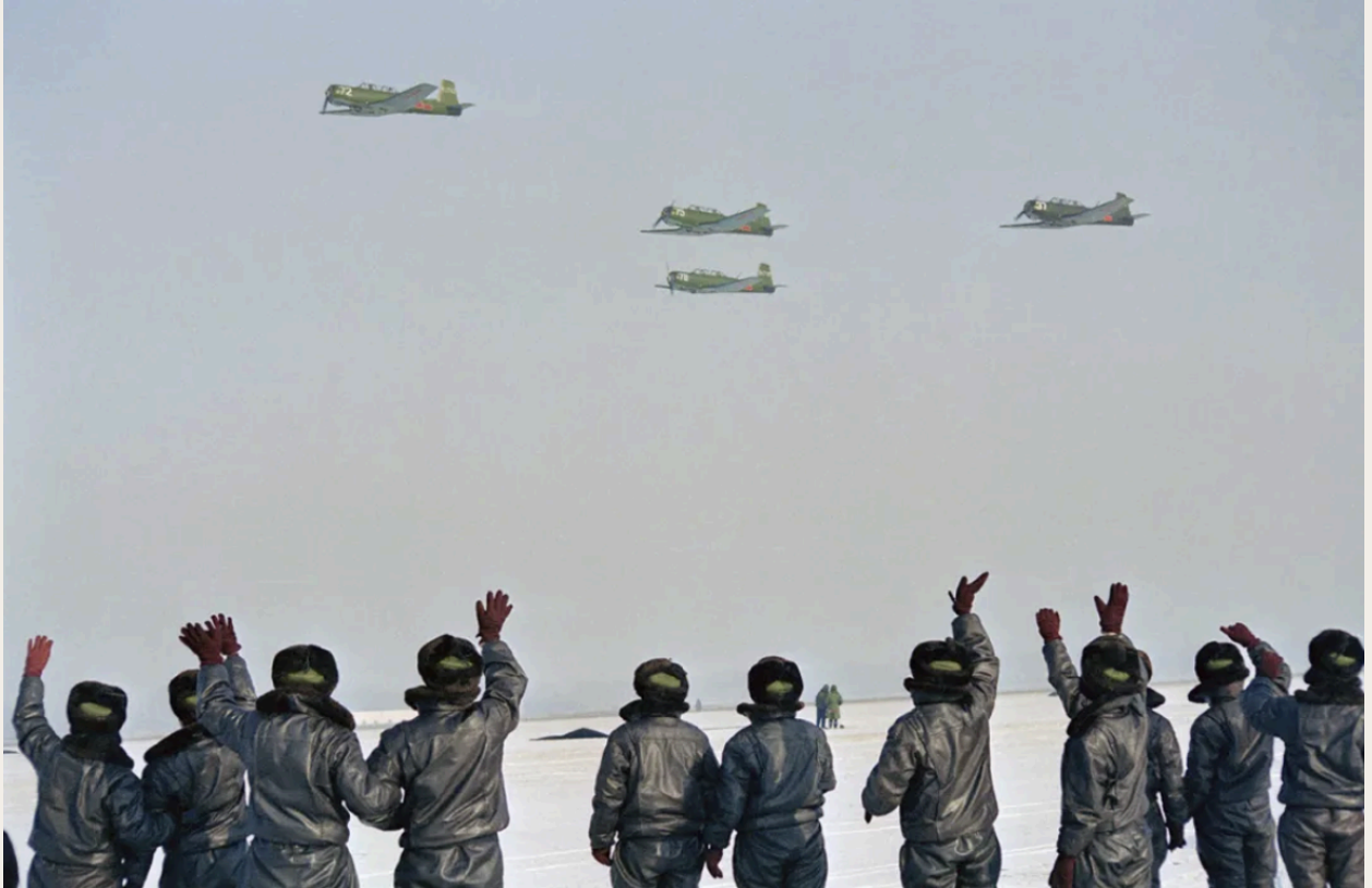
地面女飞行员挥手与飞行中的初级教练机形成互动，画面干净有动感，人物动作传递昂扬的情绪信息。1992年，辽宁沈阳一座飞行学院的女学员们在初级教练机上独立飞行。