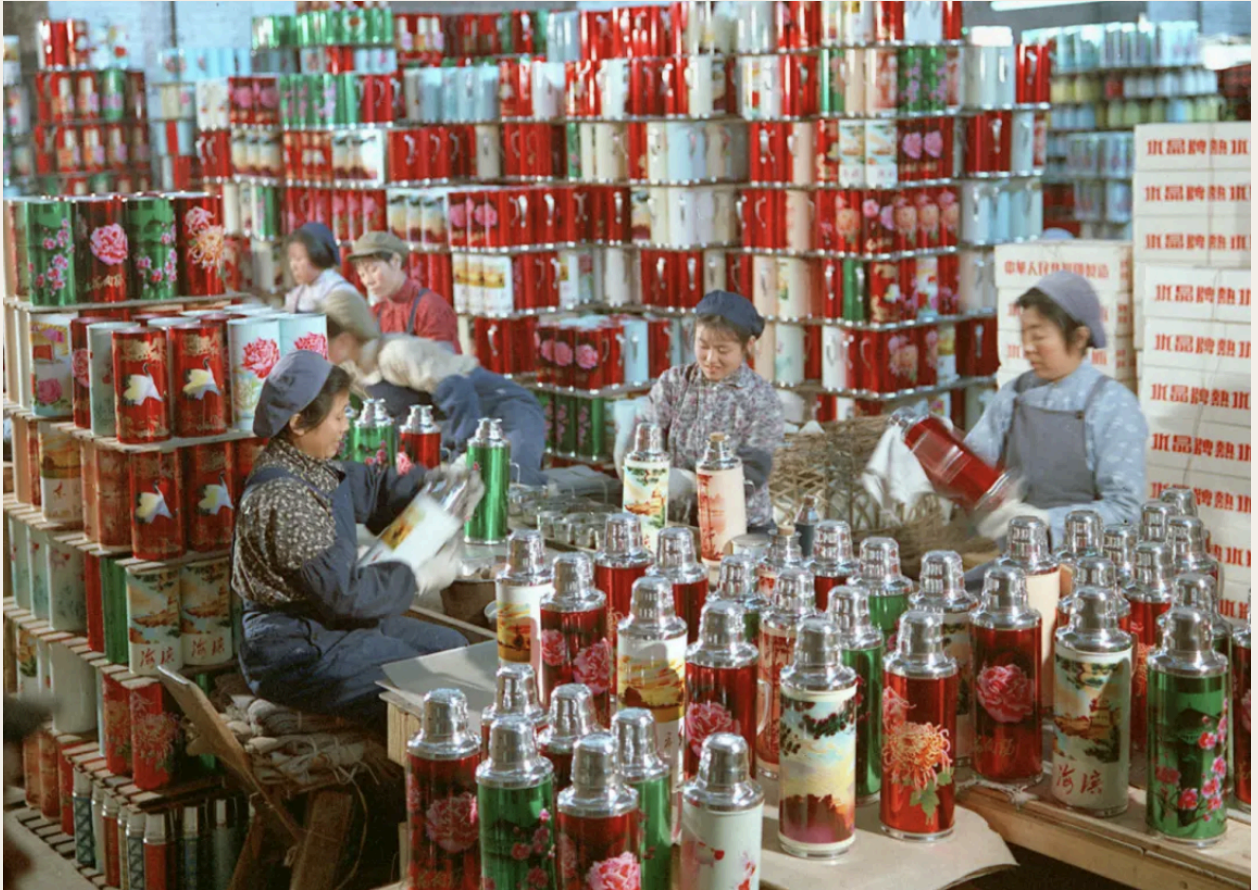
画面层次丰富，人物造型多样，色彩饱和，杂而不乱，暖水瓶成规模的堆叠很有气势，令人惊叹。1972年，辽宁大连暖水瓶厂女工在擦拭该厂生产的保温瓶。