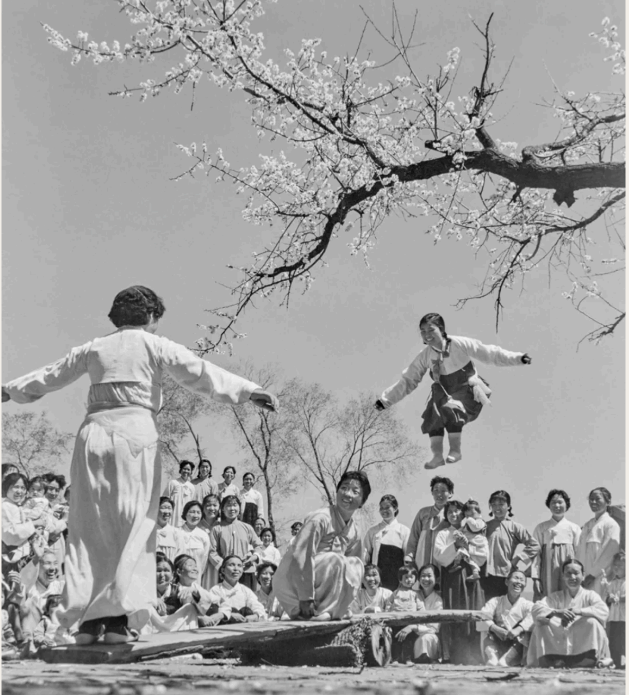
腾跳的女青年活泼、欢乐，春树上盛开的鲜花映衬出朝鲜族传统女装的美丽浪漫。1972年5月31日，吉林延边朝鲜族自治州，身着朝鲜族传统服饰的妇女们参与传统游戏跳跳板。新华社发(全悬三摄)。