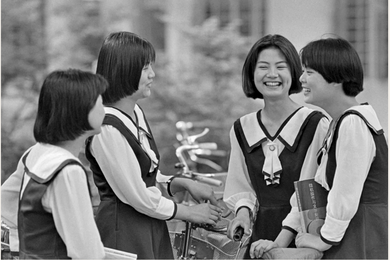
主人公欢愉的情绪富于感染力。统一的校服表现了学生身份与校园文化的独特魅力。1994年5月27日，江苏南京市女子中专的几名女学生穿着校服，在校园里聊天。新华社记者 徐澎 摄。