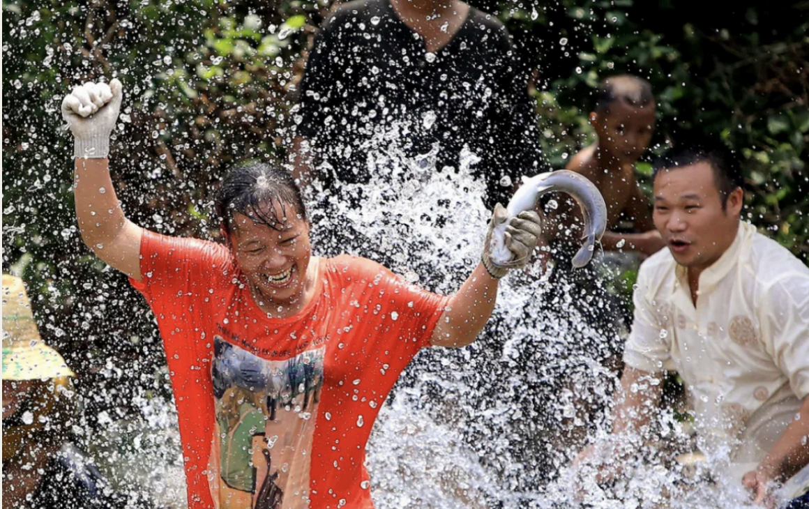
红衣妇女开怀大笑，陪体人物的反应强化了主人公的成就感。水花四溢，大大增加画面动能，让观者同时感受到夏的炎热与水的清凉。2013年8月21日，广西柳州融水县安陞乡大田村举办捉鱼活动。